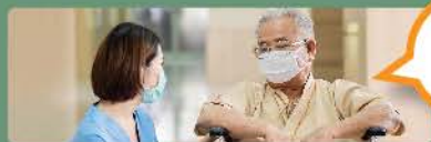
向有醫療需要的人供應即棄膠飲管